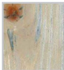
Herkömmliche farblose Lasur ohne UV-Schutz

Folge: Oberfläche makellos dank Nano-UV-Blocker