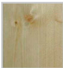
Aidol Wetterschutz-Lasur UV, farblos UV+

Drei beispielhafte Holzoberflächen nach mehrjähriger Bewitterungszeit im Vergleich.